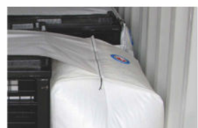
BIG Ventil (3D als Satteltasche)