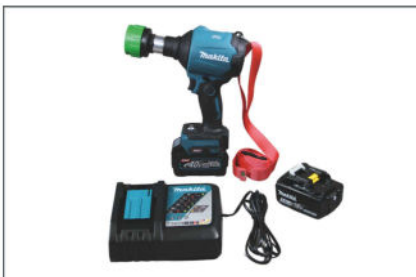
Makita Akkugebläse und SMART Adapter