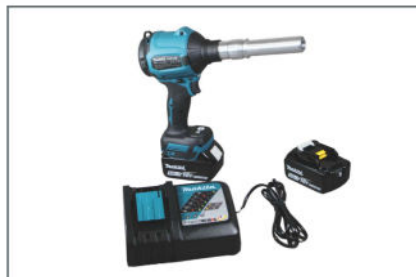
Makita Akkugebläse und TURBO Adapter