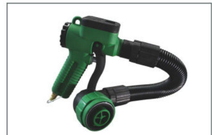
Druckluftpistole mit digitalem Manometer