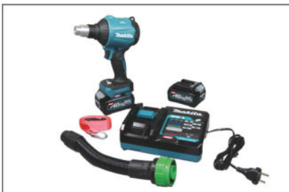
Makita Akkugebläse mit Quick Connect