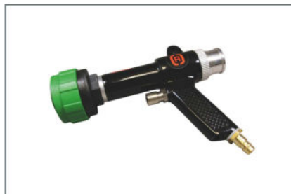
Schnellfüllpistole mit Quick Connect Adapter