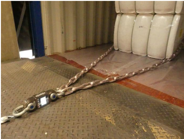
Abb. 10: Reibwertermittlung Containerboden mit Folie / Ballen