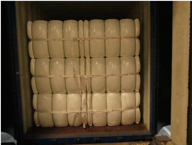
Abb. 8: Fertiggestellte Ladungssicherung mit Freiraum zur Tür