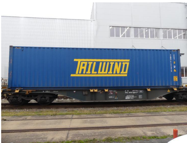
Abb. 2: Fahrdynamische Prüfung im Kombinierten Verkehr