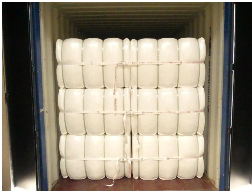
Abb. 1: 40'-ISO-Container mit 3-fach-Container-Rückhaltesystem (Hersteller G&H GmbH Rothschenk)

Die Lenzing AG versendet Ballen mit einem Gewicht bis ca. 315 Kg pro Ballen mit bis zu 22 t (Netto) in 40'-Containern. Die Ballen werden 3-fach übereinander gestapelt und sind in Kunststoffolie mit der Materialnummer 40267 und 40268. eingeschlagen und zusätzlich mit 19 mm breiten PET-Bändern (Mat.-Nr. 40187) zu einer Ladeeinheit verpresst. Es werden bis zu 72 Ballen geladen. Bei einem Lieferantenwechsel sind die Leistungsdaten aus der Spezifikation mindestens einzuhalten.