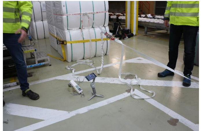
Abb. 11: Reibwertermittlung Ballen / Ballen