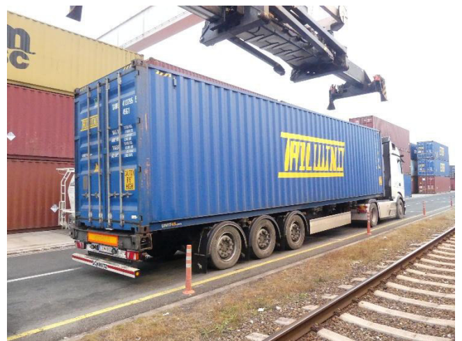
Abb. 3: Fahrdynamische Prüfung im Straßenverkehr