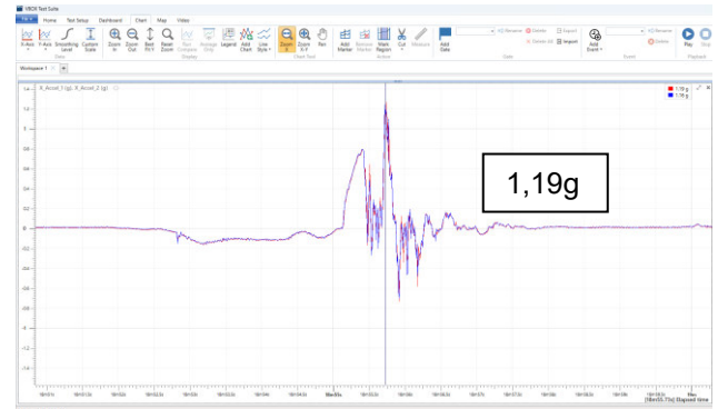
Abb. 5: Rückwärtsbremsung aus ca. 7 km/h auf LKW