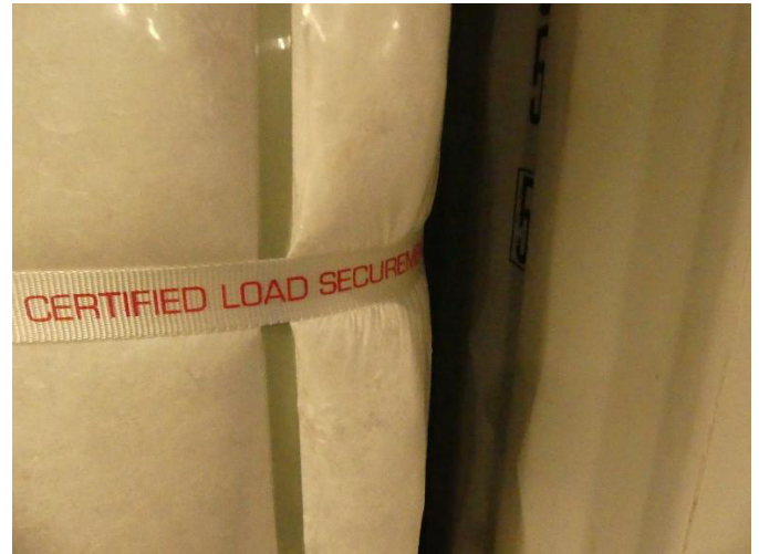
Abb. 9: Kontaktpunkt Rückhaltesystem / Ballen

Die Ladungssicherung erfolgt über eine Lashing-Komponente mit einer Fixierung an 2 Zurrösen am Containerboden und 2 Zurrpunkte im Bereich des Containerdachs. Die Vorgaben zur Lastverteilung sind gemäß dem CTU-Code und in Deutschland nach VDI 2700 Blatt 14 einzuhalten.