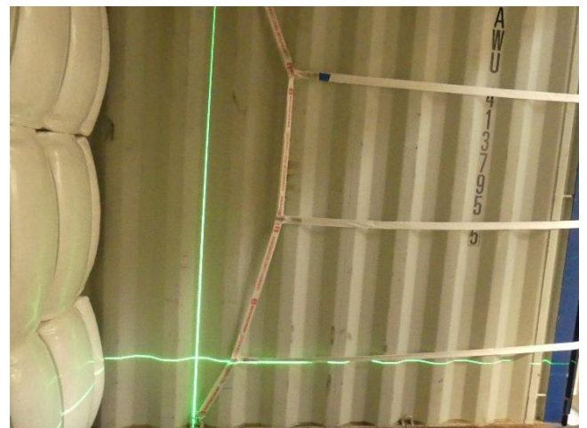
Abb. 7; Ansicht Rückhaltesystem von der Seite