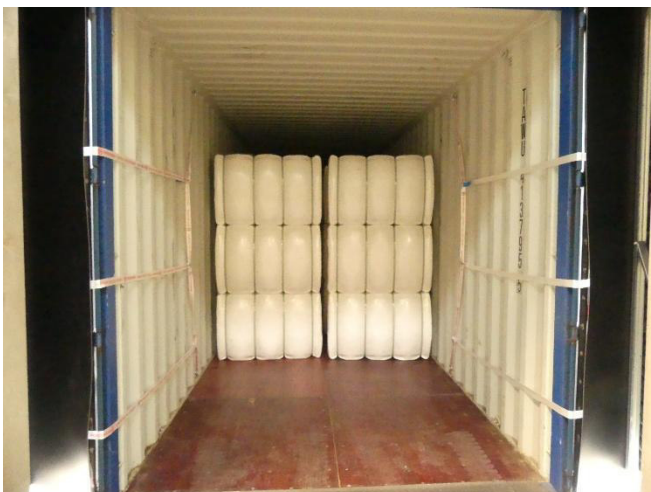
Abb. 6: Vorbereitung der Beladung mit Rückhaltesystem

Das Rückhaltesystem blieb auch nach wiederholten Belastungsprüfungen (2-Bremmung Schiene, 2 x Bremsung LKW) stabil und hatte noch eine wirksame Vorspannkraft.